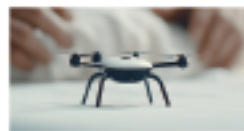
激光雷达 (小型无人机)