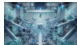
高速作业机器人的“眼睛”