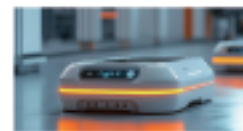
激光雷达 (用于自主移动机器人)