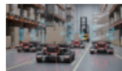
高密度AMR群控群办运营